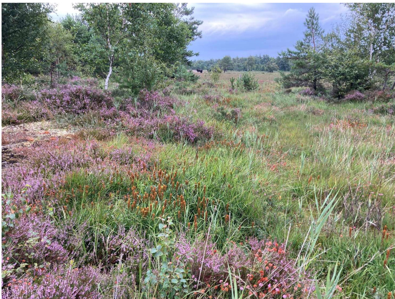
Benbræk i Nordmarken

* Omfatter ikke offentlige arealer, hvor ejeren gennemfører Natura 2000-planen i egne planer for forvaltningsindsatser. Se resumé af plan for forvaltningsindsatserne i bilag 1.